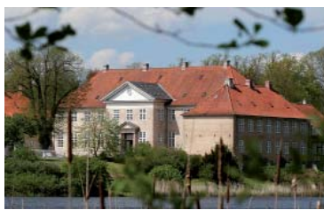
SKJOLDENAESHOLM HOTEL A menos de una hora del centro de Copenhagen, el mejor ejemplo de una mansión de campo danesa. Rodeado por campos, lagos y bosques, el edificio data de 1662 y es propiedad de la familia Bruun desde hace 8 generaciones. Hotel desde 1971 está todo renovado con el encanto tradicional. 38 habitaciones en varios edificios, decoradas de forma particular. El hotel está rodeado por un hermoso parque.

Día-8 Vuelo de Regreso Según la hora de tu vuelo de regreso, aprovecha el día para continuar visitando Copenhagen, o alguno de los castillos de la zona norte de Zelândia. A la hora indicada devuelve el coche de alquiler en el aeropuerto, antes de tomar el vuelo de regreso a casa. Llegada y fin del viaje.