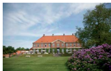
HINDSGAVL SLOT Cuando uno conduce por la avenida que lleva al castillo tiene la sensación de entrar en otro mundo y en otro tiempo. En la costa de Funen, un lugar rodeado por unos magníficos jardines y paisajes. Heredero de una fortaleza del siglo XIII y testigo de eventos históricos daneses hoy acoge un afamado restaurante y un hotel con 117 confortables habitaciones en el castillo y en edificios anexos. Dispone de elegantes salones y un simpático fantasma.