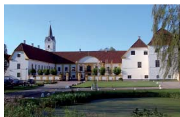
DRONNINGLUND SLOT Originalmente un convento de monjas benedictinas del año 1100, pasó a ser propiedad de la corte tras la reforma y se convirtió en castillo y mansión. Al haber sido propiedad real, el lugar aparece a menudo en la historia danesa. Hoy es un hotel bien equipado con 22 habitaciones y hermosas zonas comunes. El restaurante del castillo tiene fama por su cocina de carácter gourmet y los paisajes de los alrededores tienen mucho encanto.