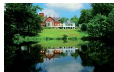
HAVREHOLM SLOT En un lugar muy bonito, cerca de la playa y a solo media hora de Copenhagen, Havreholm es una de las mansiones más hermosas de Zelândia. Havreholm es un pueblo muy antiguo y con mucho encanto en el centro del cual se levanta el hotel de finales del s. XIX, conocido como "el castillo". Hoy es un hotel moderno en un entorno clásico con habitaciones renovadas y un buen restaurante.